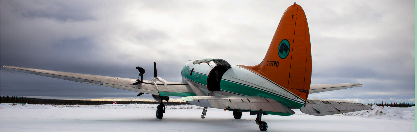
Le Curtiss C-46F Commando C-GTPO de Buffalo Airways à Colville Lake Tommy Kochon.

Avec l'appareil immatriculé C-FAVO, le Curtiss C-46F Commando C-GTPO est un des deux avions de ce type en fonction au sein de la flotte de Buffalo Airways. Tout deux sont ordinairement opérés depuis la base de Yellowknife dans les Territoires du Nord-Ouest, mais il n'est pas impossible de les voir de temps à autre dans d'autres provinces du Canada au gré des contrats attribués à la compagnie.