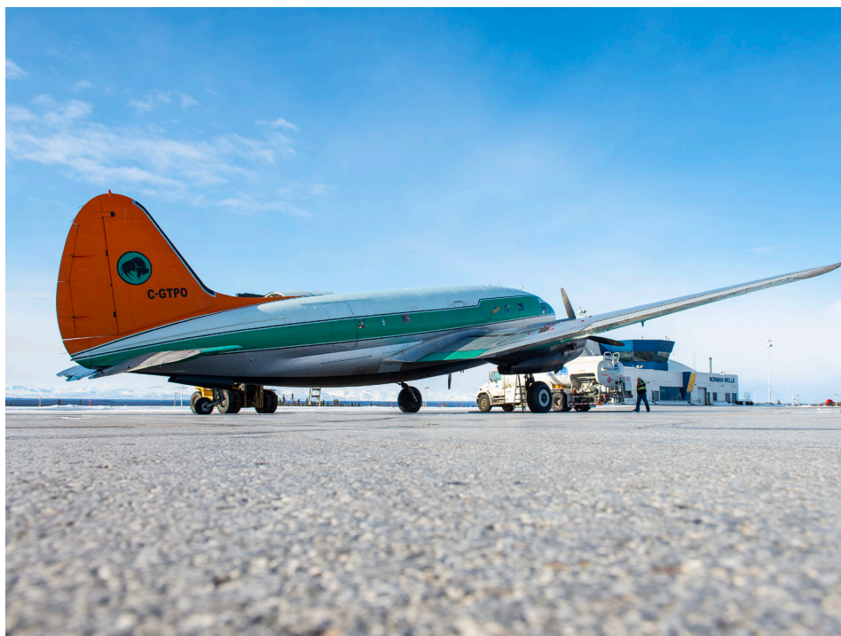
En haut : en se rapprochant de Norman Wells, la vue de la Vallée de la Mackenzie devient spectaculaire. Ci-dessus : première étape de la tournée de livraison à Norman Wells.

sont sorties une à une par le chariot-élévateur qui les dépose ensuite à bord du camion. Ainsi, environ 4.000 à 5.000 livres de marchandises sont transférées du C-46 au camion.