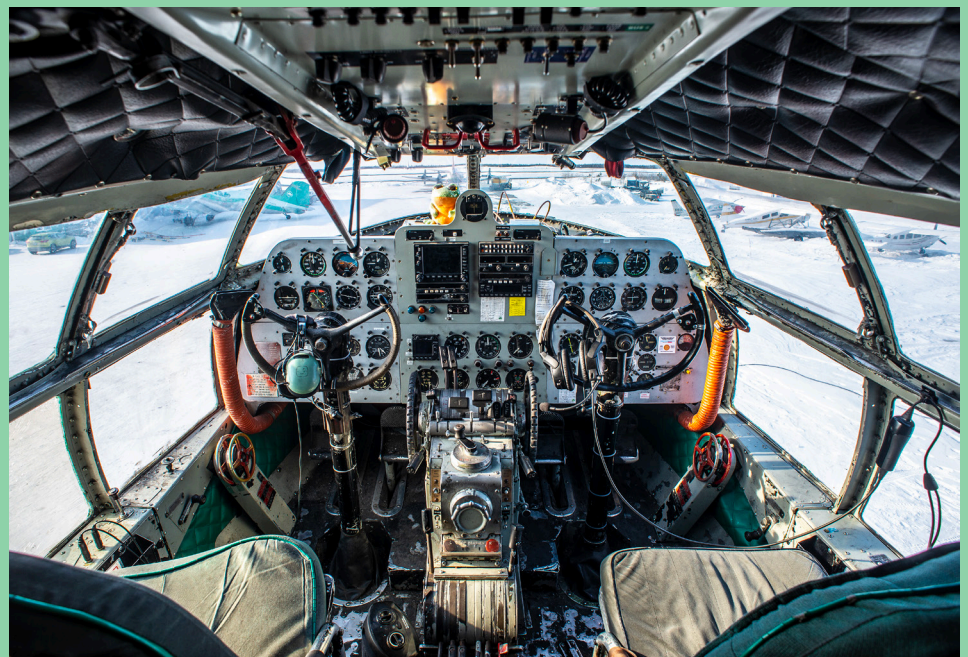
L'avionique du C-46 C-GTPO est constituée à la fois d'instruments traditionnels et d'équipements récents.

Air Manitoba Ltd de Winnipeg puis, le 25 août 1993, il passe officiellement aux mains de Buffalo Airways. Du 7 octobre 2004 au 17 novembre 2010, il est enregistré au nom de FNT First Nations Transportation Inc. de Gimli au Manitoba. Enfin, depuis, il est de retour dans la flotte de Buffalo Airways.