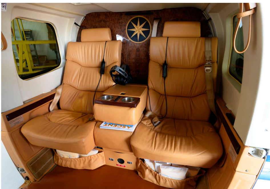
Les hélicoptères de GrandView Aviation (Bell 430 N255MK en haut et ci-dessus, Bell 407 N407MG au centre) disposent un confortable intérieur luxueux.

haitant souvent un appareil bimoteur, un Bell 430, immatriculé N255MK, est mis en opération par Baltimore Helicopter Services dans le courant de l'année 2012 de même qu'un Airbus Helicopters AS350B2. Enfin, en 2014, un nouveau Bell 407 immatriculé N407MG vient remplacer l'appareil du même type, mais plus ancien.