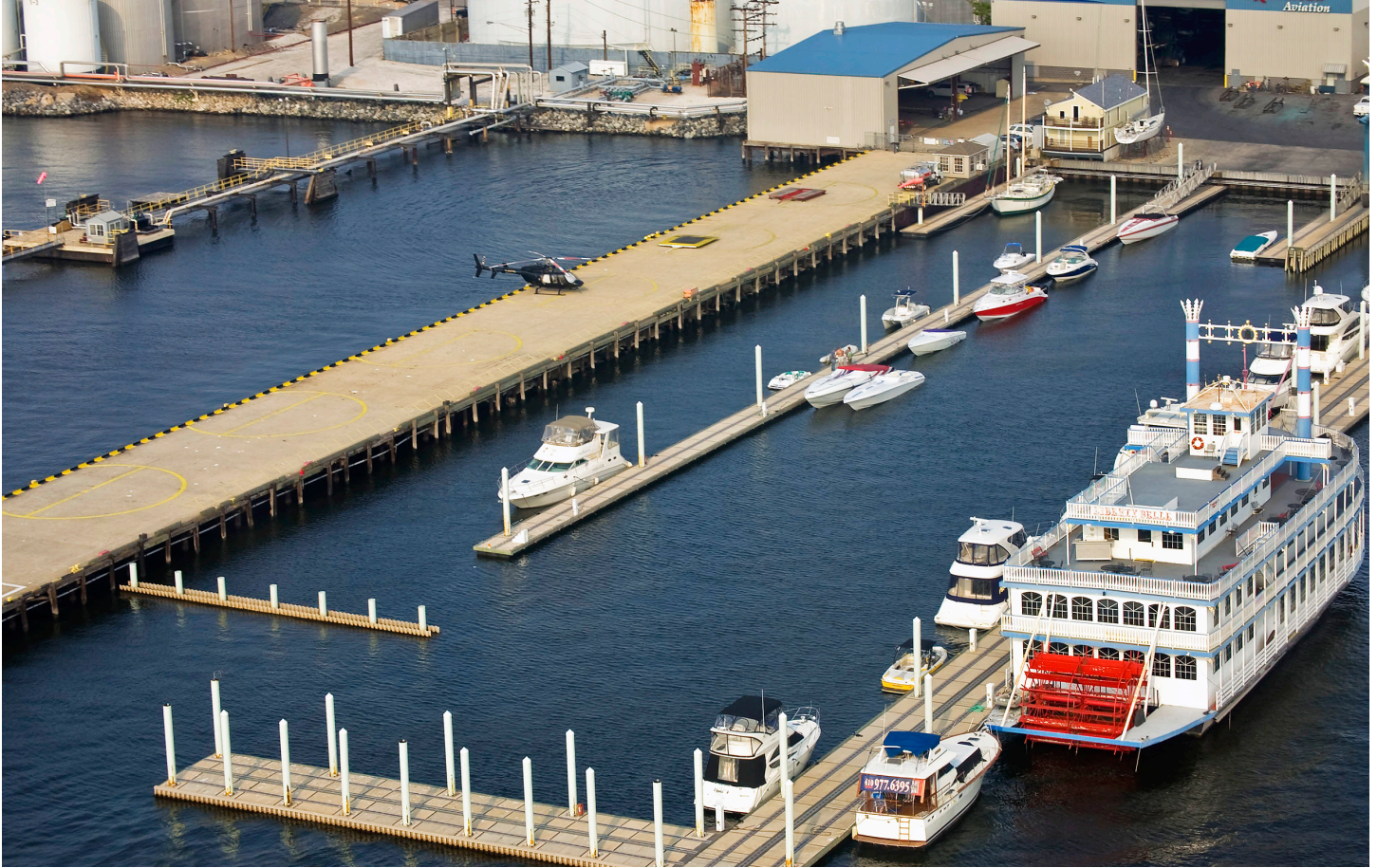
Ci-dessus : vue aérienne de l'héliport et de son hangar implanté dans les installations du chantier naval et d'une marina appartenant au groupe de la Baltimore Marine Centers. En bas : l'héliport de Baltimore permet de rejoindre rapidement et efficacement la majorité des grands centres urbains de la côte est des États-Unis.

Une particularité chez GrandView Aviation est le fait que vous pouvez directement obtenir une offre de prix par le site Internet de la compagnie. Il vous suffit de rentrer le point de départ et le point d'arrivée, d'indiquer la date du voyage ainsi que le nombre de passagers qui prendront part au vol et le tour est joué après avoir choisi le type d'appareil qui vous convient ! Vous obtiendrez ainsi la durée du vol de